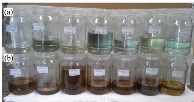
Figura 2. Frações da destilação molecular do óleo-resina de copaíba na corrente de destilado (a) e na corrente de resíduo (b)

e, conseqüentemente, purificação de sesquiterpenos para a corrente de destilado.