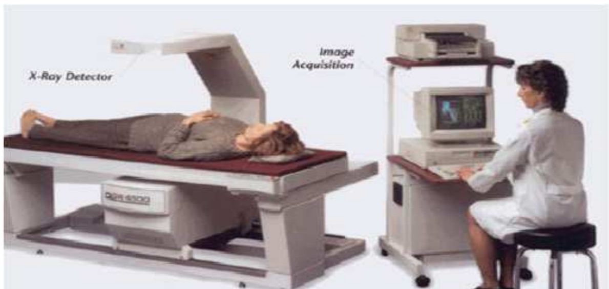
Figura 3: O aparelho em funcionamento.

O aparelho funciona como um scanner, e com uma única varredura de corpo inteiro, é capaz de analisar a composição corporal de uma pessoa, dividindo-a em distribuição mineral óssea, massa magra e massa gorda.