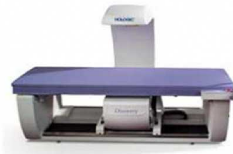
Figura 2: O equipamento DXA (Absorciometria Radiológica de Dupla Energia Hologic®).