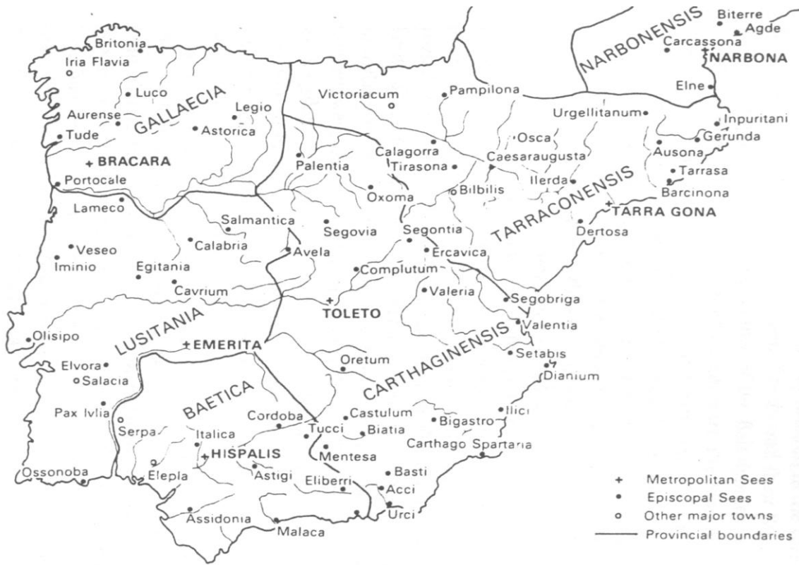
Mapa 2: Hispânia visigoda c. 600.