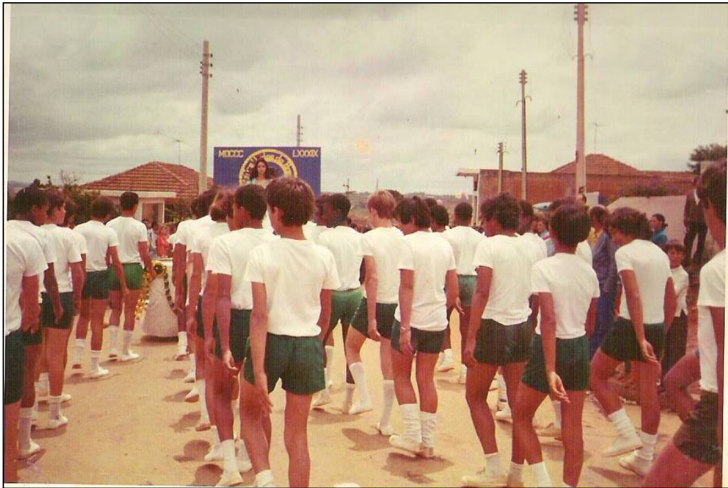
A exigência de uniforme para meninos