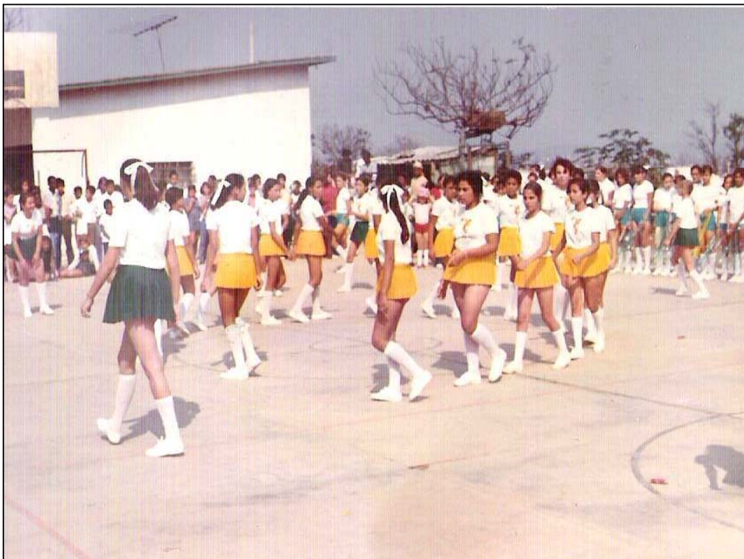
A exigência de uniforme para meninas