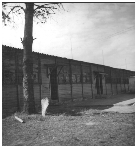
As duas escolas: o prédio central (3 primeiras fotos) e o galpão de madeira