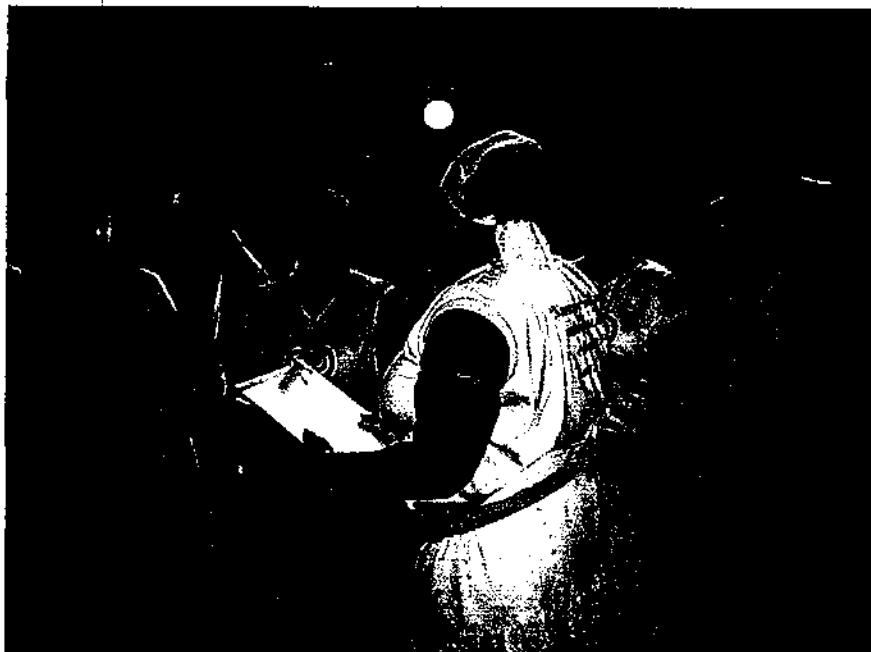
Foto 10: Cerimônia de Entrega do Registro do Jongo como Patrimônio Cultural Imaterial do Brasil (17/12/2005)