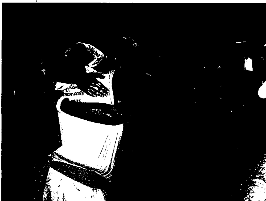
Foto 6: Cerimônia de Entrega do Registro do Jongo como Patrimônio Cultural Imaterial do Brasil (17/12/2005)

foi entregue às comunidades no dia 17 de Dezembro de 2005, na ocasião do 10º Encontro de Jongueiros.