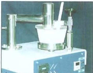
Fig. 3: Moinho para tecidos duros com grau e pistilo de porcelana

conhecendo-se o comprimento de onda ideal para o Azul de Metileno, foi obtida a equação de reta que possibilita relacionar as absorbâncias das amostras, determinando suas concentrações.