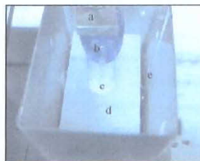
Fig. 2: Recipiente metálico da máquina onde foi posicionado o espécime