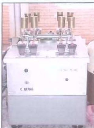
Fig. 1: Máquina de Escovação

Em seguida, foram misturados 4,6mL (6g) de dentifrício Sorriso (Kolynos do Brasil) previamente pesado em balança de precisão, com 6mL de água destilada e vertidos no recipiente metálico da máquina de escovação. Este dentifrício foi escolhido por se tratar de um material que contém um abrasivo muito utilizado, o carbonato de cálcio, e por se tratar de um material de uso freqüente (Heath & Wilson, 1976). A proporção de 1:1 em peso foi utilizada para diluição do dentifrício pois é a mais próxima da utilizada in vivo (Frazier et al. , 1998).