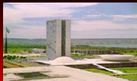
CONGRESSO NACIONAL VERGONHA NACIONAL

Se você se considera um, ignore esta mensagem, AGORA se você é contra essa pouca vergonha.