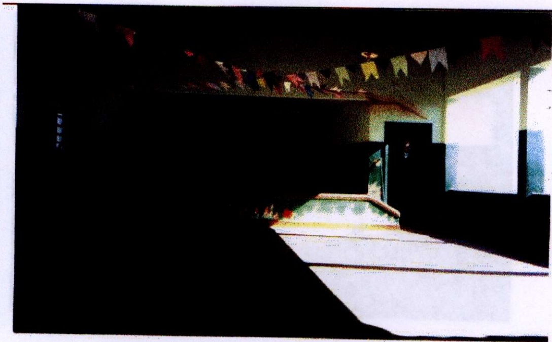
Foto do barracão coberto mais mini teatro da EMEI “Ganymedes José”