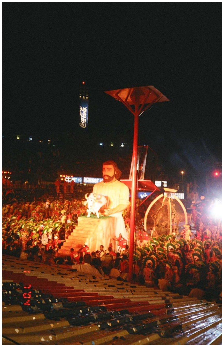
Figura 1: - São José – (Alegoria do Bumbá Garantido).