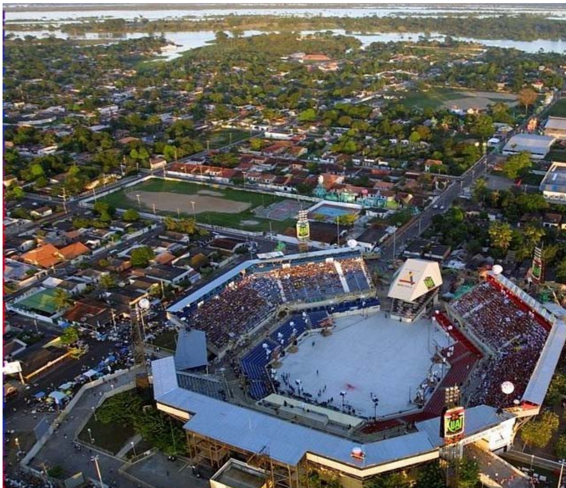
Figura 6: - “Bumbódromo”.