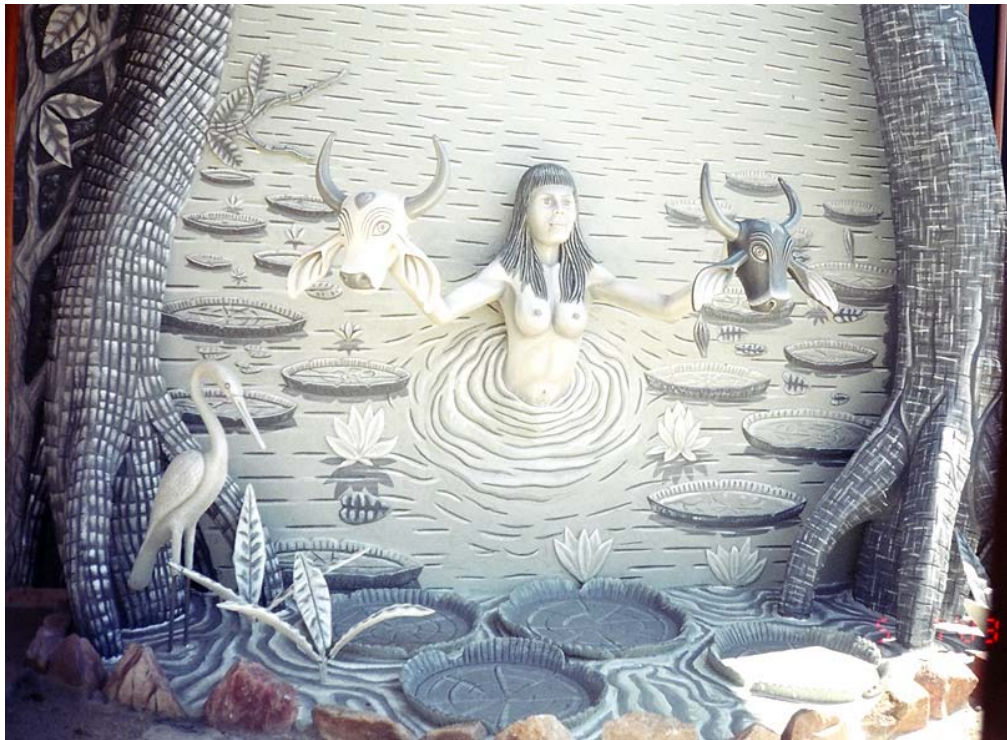
Figura 17: - Mural de residência parintinense - Fonte: Silva, M.H.R., 2003.