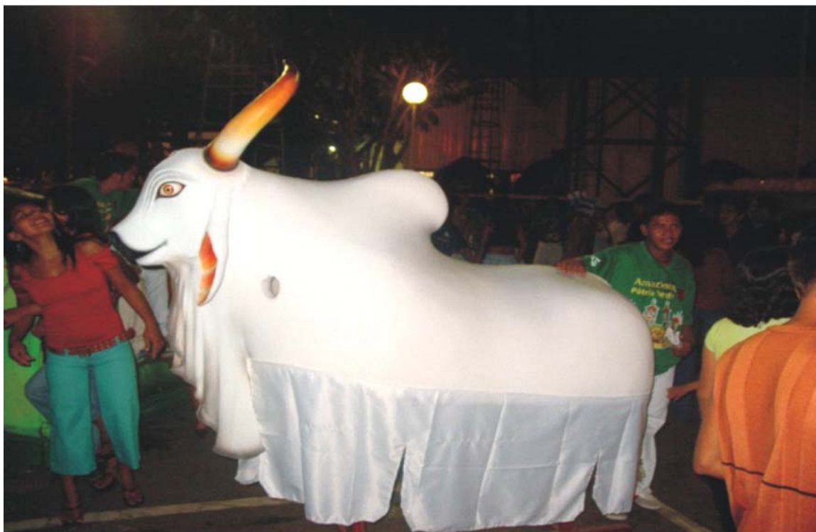
Figura 7: - Boi Bumbá Garantido - Fonte: Silva, M.H.R., 2004.