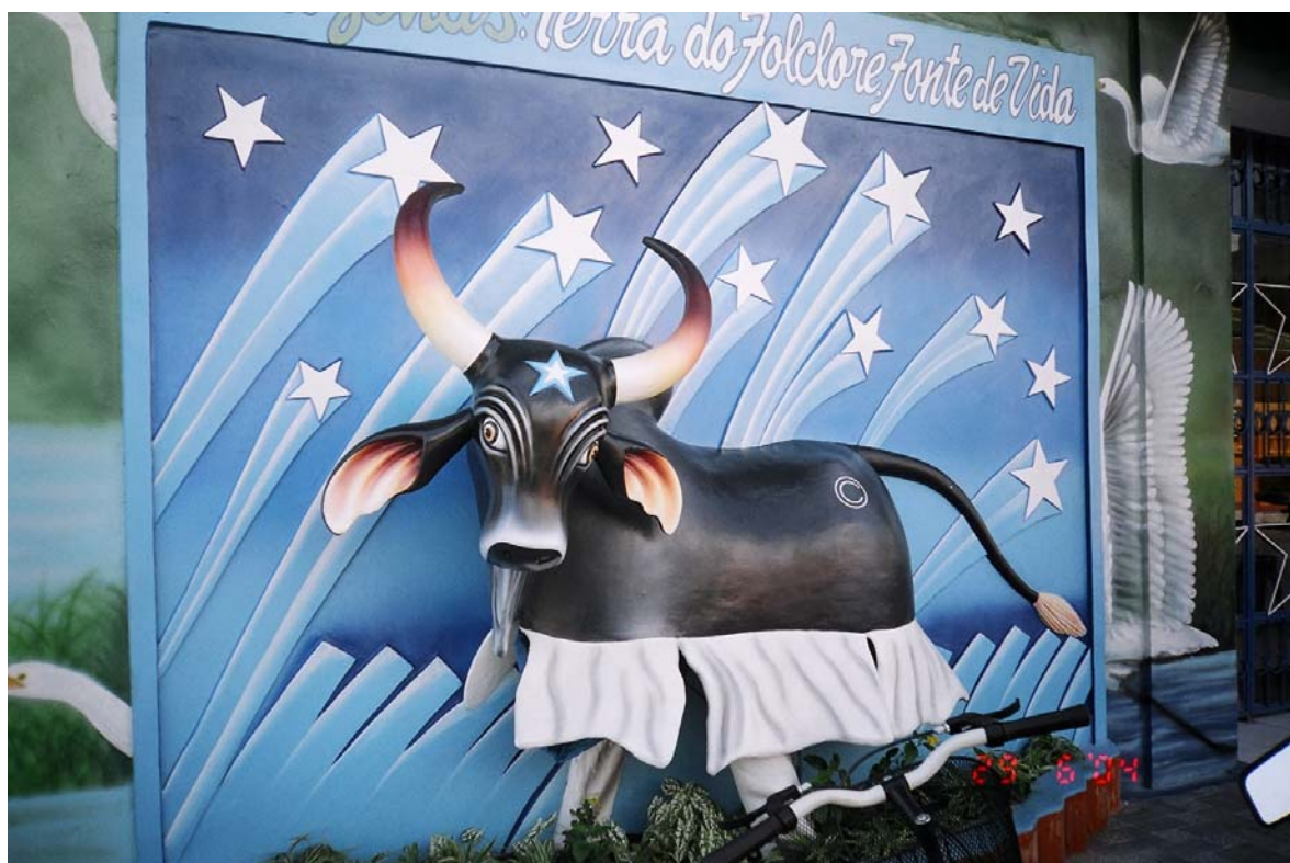
Figura 9: - Fachada de residência - (Boi Bumbá Caprichoso).