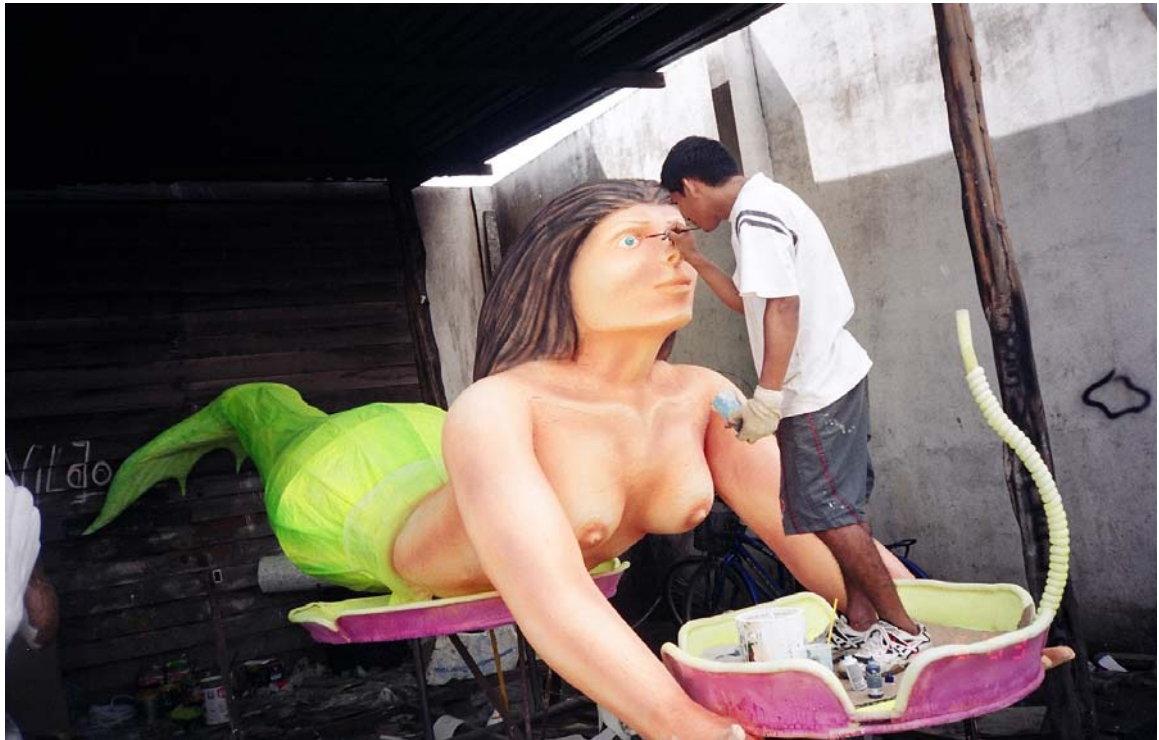
Figura 116: - Confecção de Alegoria