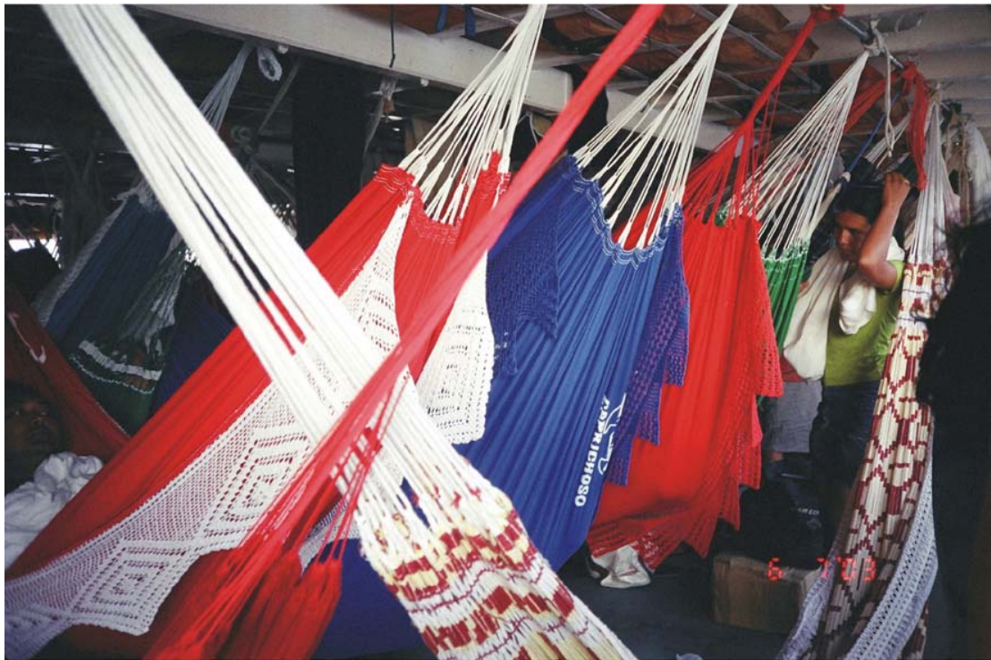
Figura 4: - Barco a caminho de Parintins ( “dormitórios”) -