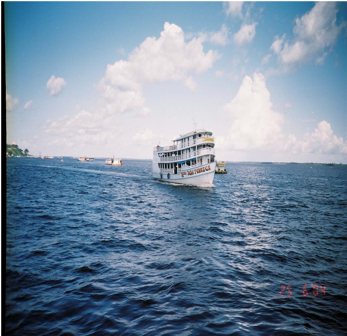
Figura 2: - Embarcação Regional.