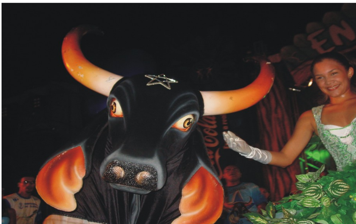
Figura 8: - Boi Bumbá Caprichoso