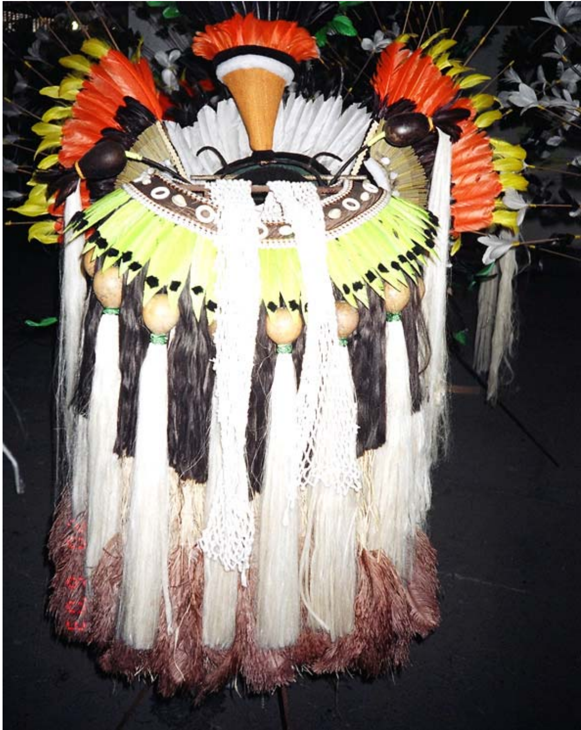
Figura 19: - Componente de Vestuário