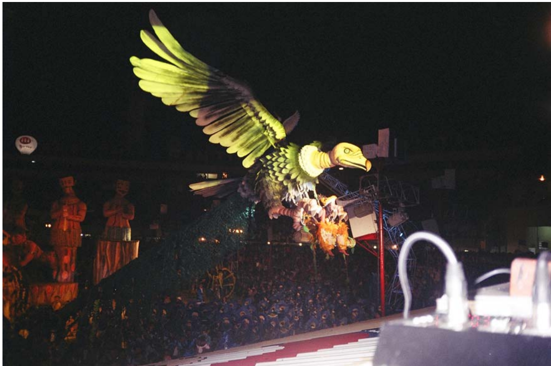
Figura 20: - Apresentação de Alegoria -