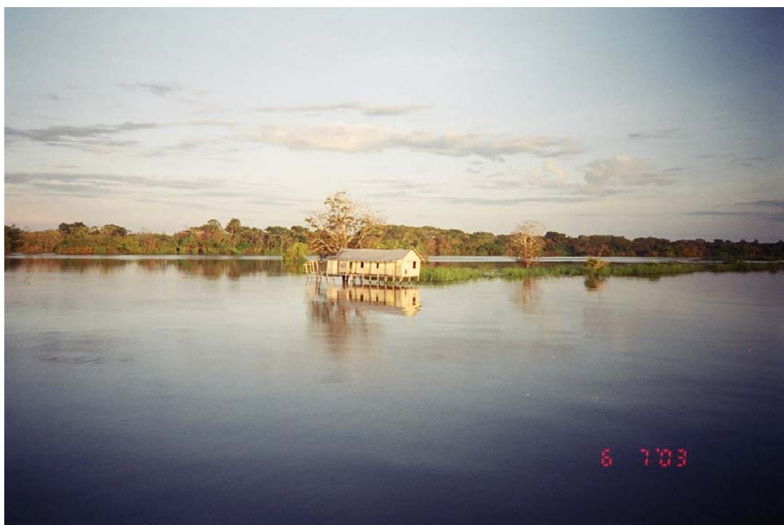
Figura 3: – Palafita – (Moradia típica da região).