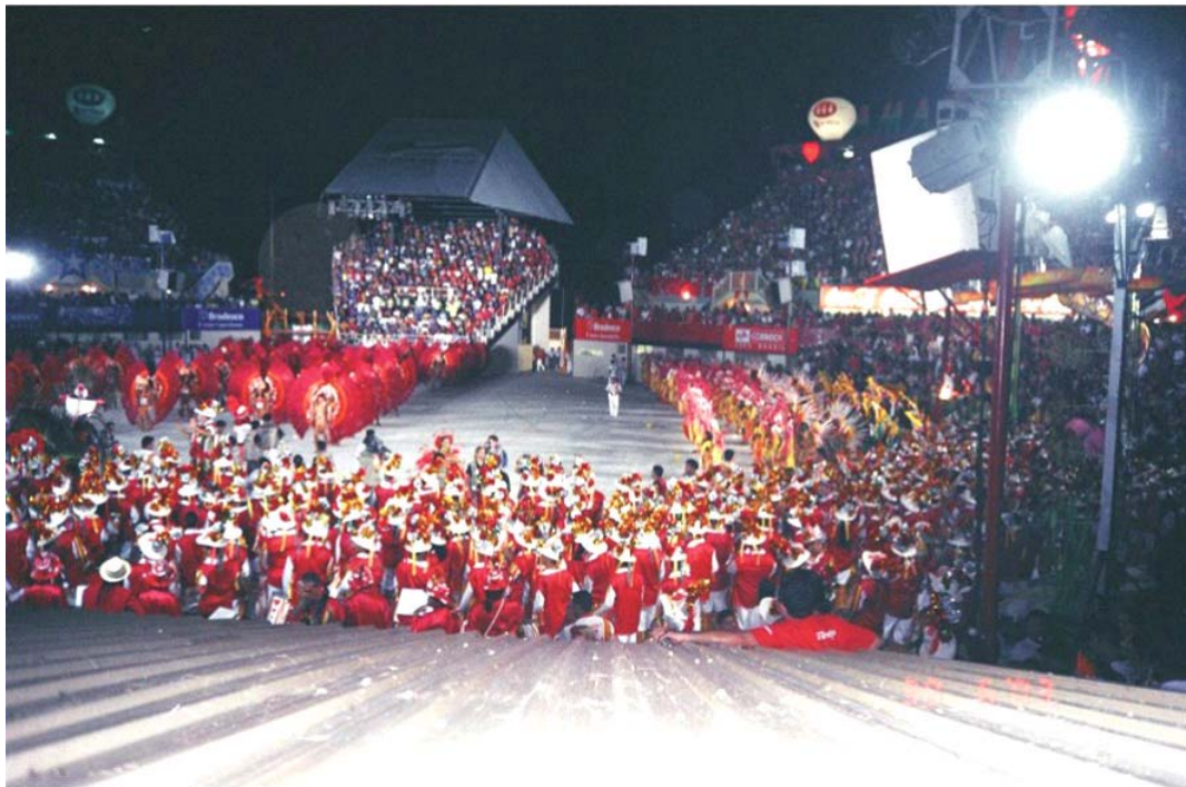
Figura 14: - Apresentação no Bumbódromo (Garantido)