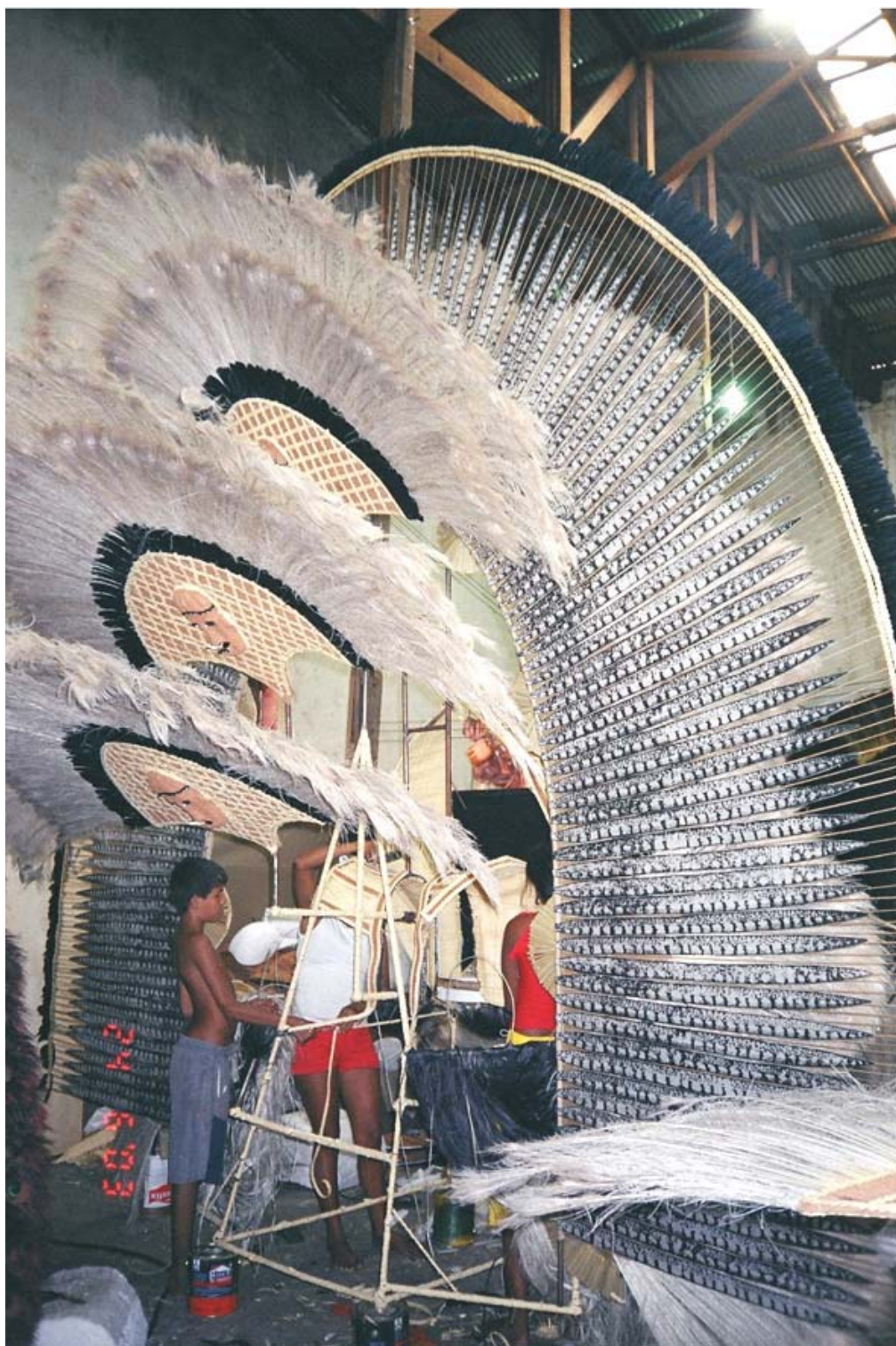
Figura 12: - Confeção de Capacetes dos Tuxauas