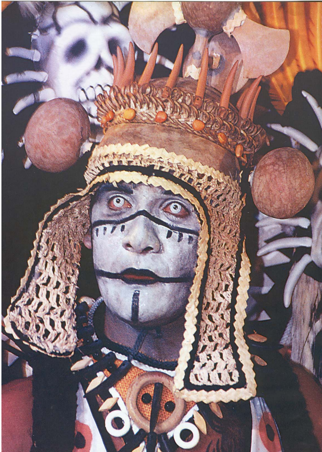
Figura 18: - Pajé – (Caprichoso)