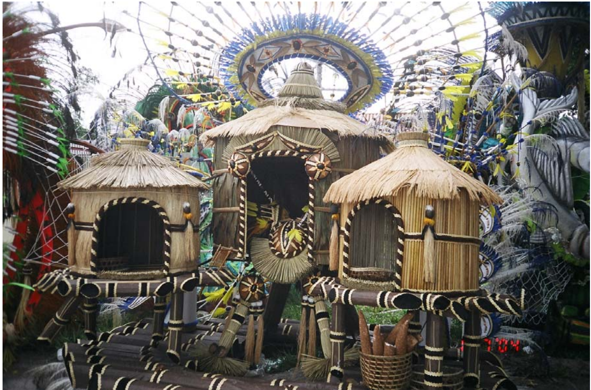
Figura 13: - Capacetes dos Tuxauas