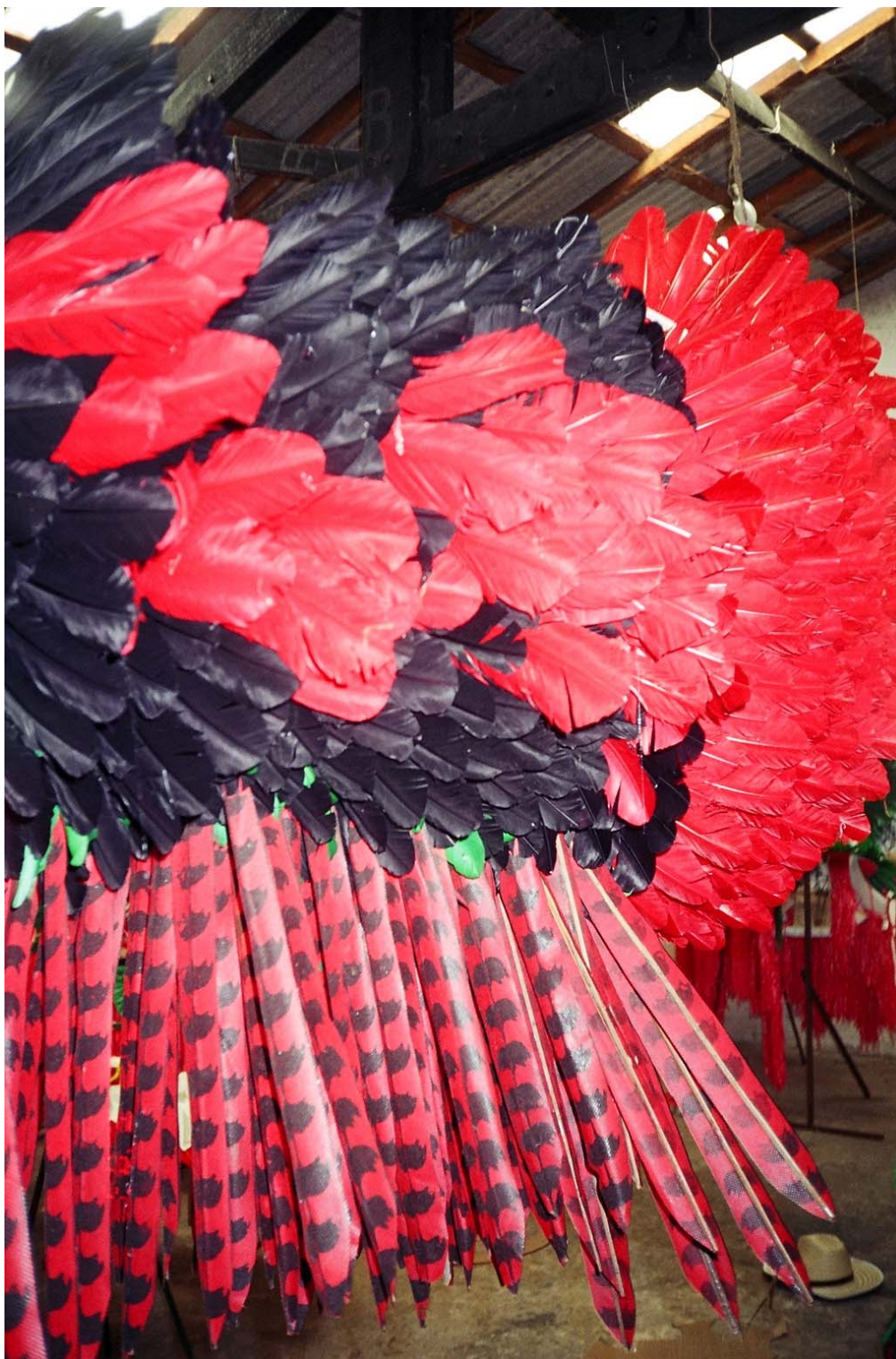
Figura 10: - Componente de Vestuário -