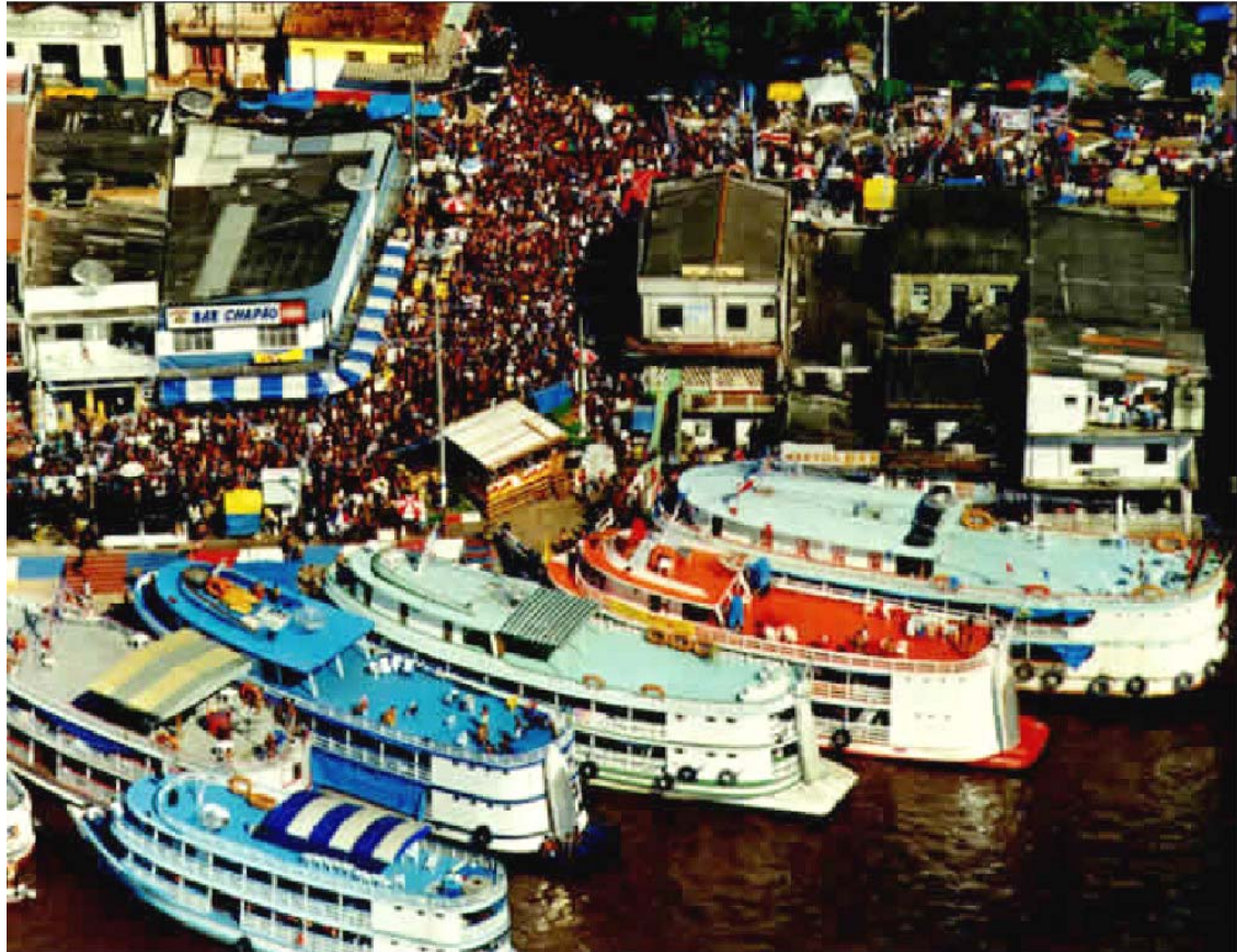
Figura 5: - Parintins (Porto)