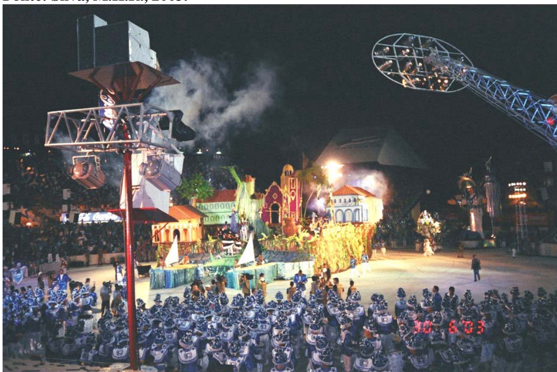
Figura 15: - Apresentação no Bumbódromo (Caprichoso)